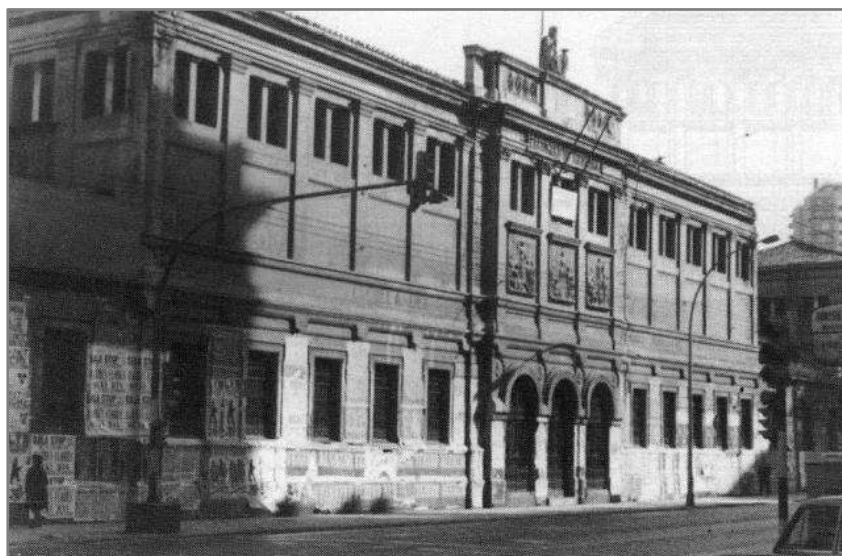
Antigua Facultad de Medicina de Valencia. 3

Fue escasamente un año Médico Titular de la localidad de Bétera debido a que amplió los estudios de medicina en Alemania, realizando la especialización en Obstetricia y Ginecología, a su regreso se incorporó a las tareas del profesorado de la Facultad de Medicina de Valencia, obteniendo por concurso-oposición, inicialmente el grado de Profesor Ayudante de Clases Prácticas el 1 de febrero de 1883 1 2 .